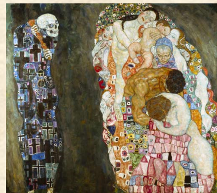
"Vita e Morte" di Gustav Klimt