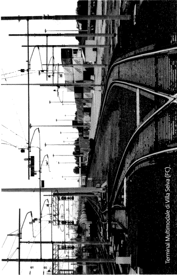
Terminal Multimodale di Villa Selva (FC).

AN EXTENSIVE RANGE OF STRATEGIC CONNECTIONS.