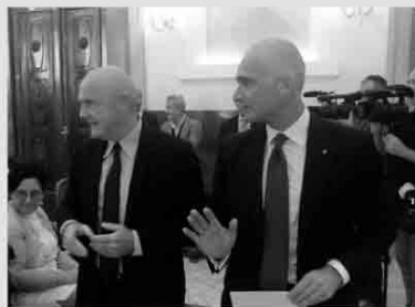
Grassi e Rotisce

Una conseguenza del "patto di ferro" stretto tra il prefetto Raffaele Grassi e Confindustria, che a settembre si recò con circa 60 propri iscritti all'Ufficio territoriale del Governo. Grassi parlò di "guerra di liberazione" ad indicare, con estrema chiarezza, che d'ora in avanti non ci sarà più spazio per contiguità, connivenze, silenzi, teste abbassate. O con lo Stato nella lotta per la legalità o contro.