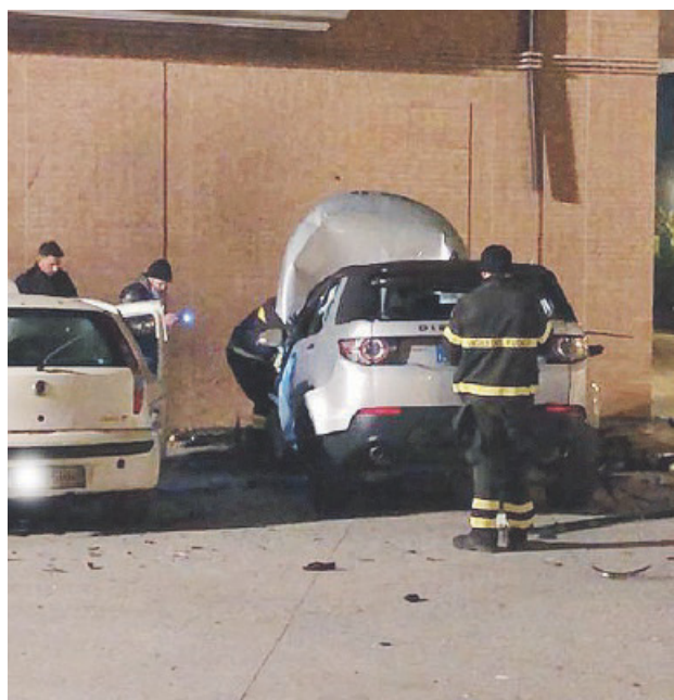
L'attentato del 3 gennaio contro l'auto di dirigente