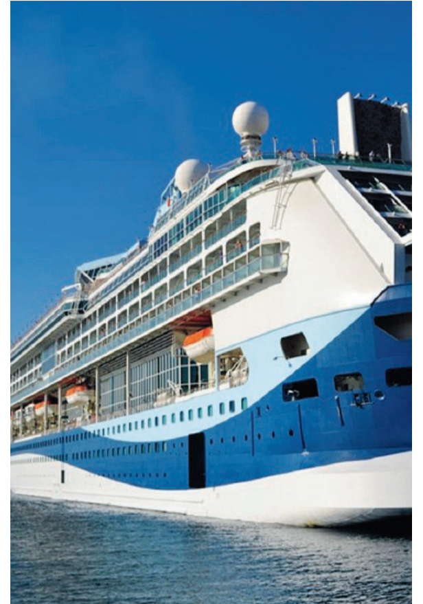
MANFREDONIA Futuro crocieristico per il porto?