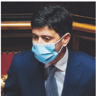
SALUTE Roberto Speranza

«Rt è molto utile per segnalare un andamento» ma, secondo Battiston, «non può essere sufficiente da solo per avere un quadro epidemiologico completo ai fini della gestione dell'epidemia. L'individuazione delle zone rosse, gialle e arancioni parte dal valore dell'indice Rt, ma deve considerare anche il grado di sviluppo dell'epidemia sul territorio - osserva Battiston - in quanto va anche inclusa nella valutazione la quantità dei casi positivi nella regione: sono i due valori insieme che determinano quanto rapidamente può ripartire l'epidemia e permettono di valutare il rischio di saturare il sistema sanitario territoriale».