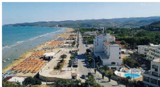
VERSO L'ESTATE Il lungomare di Vieste

e-commerce che consentirà a tutte le attività economiche di Vieste di potersi iscrivere gratuitamente e poter fare acquisti online, ma anche la possibilità di ordinare una pizza, un panino o un piatto da asporto, o ordinare un caffè con la app dal tavolino di un bar e poter pagare direttamente con il telefonino evitando file alla cassa e contatto con