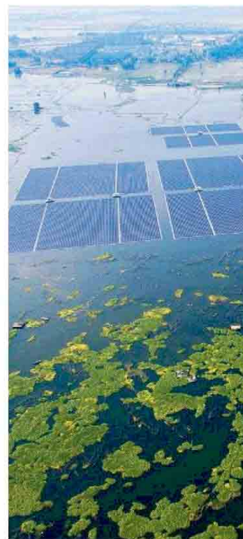
Un impianto fotovoltaico flottante

I Comuni invece hanno puntato in particolare su lavori di riqualificazione e recupero dei centri storici, di siti archeologici (come ad esempio Faragola, ad Ascoli Satriano per cui sono stati chiesti 1,5 milioni di euro), di recupero di immobili storici e sulla valorizzazione del patrimonio paesaggistico e ambientale: sentieristica, tratturi, piste ciclabili, mobilità slow, progetti dagli importi limitati. Spiccano tra le altre, le proposte del Comune di Volturino che ha presentato il progetto di realizzazione di Montilandia per un valore di 5 milioni di euro e il collegamento funiviario panoramico tra il borgo di Alberona e il Monte Pagliarone / Croce da 14 milioni di euro, presentato, appunto, dal Comune di Alberona. Destinati 250 milioni di euro alla manutenzione straordinaria della rete stradale periferica della provincia, un progetto presentato da Confartigianato, lo stesso ente che ha presentato il progetto del dissalatore di Manfredonia