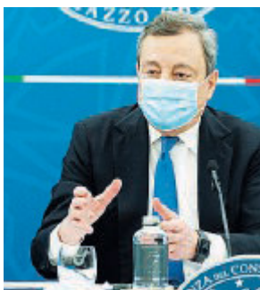
IN CAMPO Il premier Draghi

Sale giochi, sale scommesse, sale bingo e casinò possono riaprire al pubblico. Riprendono pure tutte le attività di centri culturali, centri sociali e centri ricreativi. Possibile, infine, tenere nuovamente corsi di formazione pubblici e privati in presenza.