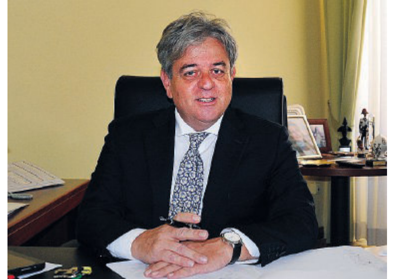
NATO A NAPOLI Il neoprefetto Carmine Esposito, 64 anni

Lungo e corposo il background del neoprefetto Esposito, che da investigatore del Centro interprovinciale Criminalpol di Napoli nel 1994 portò a termine l'operazione di polizia giudiziaria che condusse all'arresto di Rosetta Cutolo, sorella del capo della Nco (Nuova camorra organizzata) e latitante. Ci sono ancora le