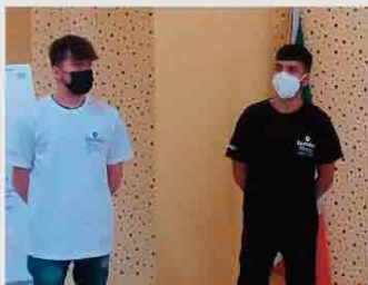
Gli alunni dell'Altamura Da Vinci