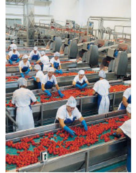
POMODORO L'industria Princes

Con la firma del Contratto Quadro, le parti hanno confermato l'attenzione della filiera alla sostenibilità etica, ambientale e sociale. In particolare, in un'ottica di tutela del territorio le Op si sono impegnate, anche attraverso la definizione di parametri qualitativi più restrittivi, a garantire una raccolta ecosostenibile e la consegna di un prodotto quanto più possibile privo di terreno e pietre al fine di venire incontro alle difficoltà registrate negli anni dalle aziende di trasformazione.