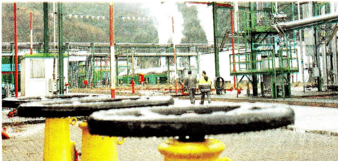
Spinta alle gare. Il Ddl Concorrenza punta alla valorizzazione delle reti di distribuzione del gas di proprietà degli enti locali

Il Ddl prevede un "Comitato tecnico per la selezione delle candidature a presidente e componente delle autorità amministrative indipendenti". Una misura che dovrebbe, secondo il governo, rafforzare l'indipendenza di Authority e Commissioni. Il Comitato sarà composto da cinque membri scelti tra «personalità di indiscussa indipendenza e di chiara fama internazionale nei settori di rispettiva competenza» (non si specifica chi li sceglierà). Il Comitato vaglia le candidature ricevute a seguito di avviso pubblico e poi trasmette ai soggetti competenti alla nomina - Parlamento e governo a seconda dei casi - una lista di almeno quattro candidati, secondo parità di genere, per ciascun membro da nominare.