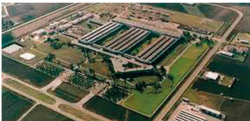
Zona Asi di Foggia

Tradotto, significa che questa azienda è or-