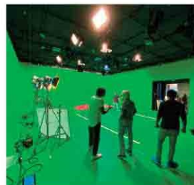
Il green screen a Foggia: uno dei più grandi di Puglia