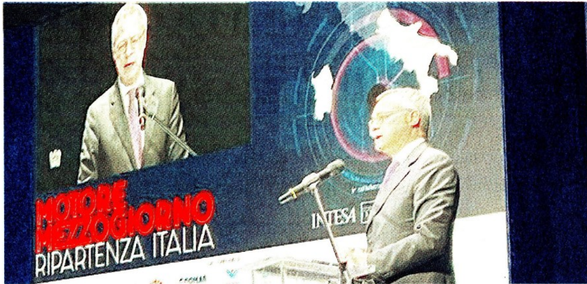
Leader degli industriali. Il presidente di Confindustria Carlo Bonomi ieri a Potenza