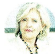
FRANCESCA MARIOTTI Direttore generale Confindustria