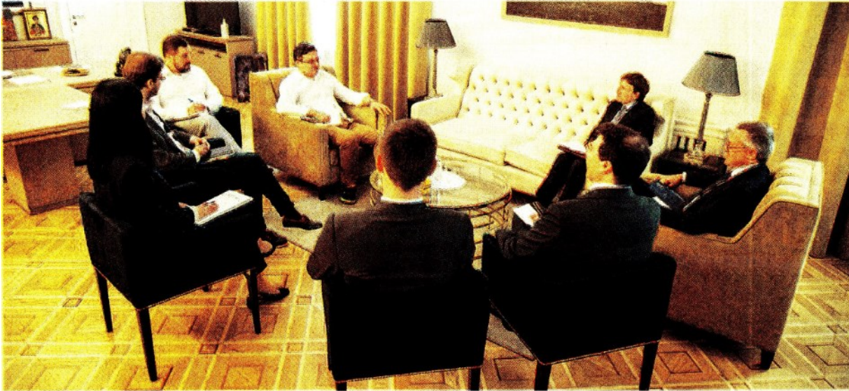
La visita. Il presidente di Confindustria Carlo Bonomi in un momento dell'incontro con il ministro degli Esteri ucraino Dmytro Kuleba ieri a Kiev