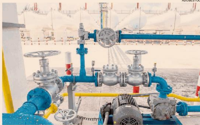
L'emergenza gas. Il governo valuta nuove mosse dopo la stretta di Gazprom

Domani il ministro della Transizione ecologica, Roberto Cingolani, vedrà in prima battuta i principali player del gas (Eni e Snam) e le società titolari delle concessioni di stoccaggio (oltre a Stozit-