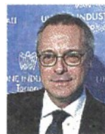
Carlo Bonomi è presidente di Confindustria da maggio del 2020 dopo aver guidato Assolombarda

per cento è la variazione acquisita del Pil italiano per il 2023, un dato che allontana lo scenario di una possibile recessione per l'anno in corso