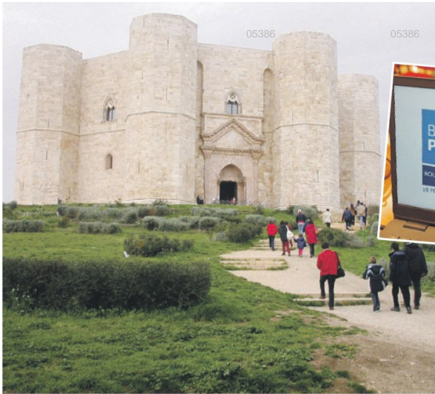
TURISMO Visitatori a Castel del Monte. Sotto, il cartello di presentazione di «BuyPuglia Routes & Experiences» e «Btm-Business Tourism Management». In basso il presidente della Regione Puglia Michele Emiliano