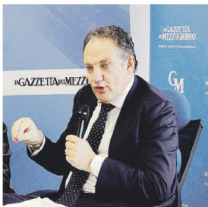
FILIPPO MELCHIORRE Senatore FdI: «Quello che diceva Conte, "vi regaliamo la ristrutturazione" è un falso. Non siamo in grado di dare "tutto a tutti", bisogna dare il "giusto a tutti"»