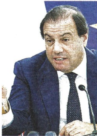
Esecutivo Maurizio Leo, viceministro dell'Economia

L'Imposta sul Reddito delle Società è dovuta da una parte delle società e degli enti operanti in Italia. È un'imposta proporzionale, con un'aliquota fissata dalla legge, calcolata sulla base imponibile.