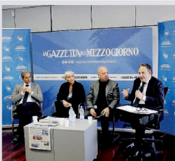
IN REDAZIONE Un'istantanea del dibattito