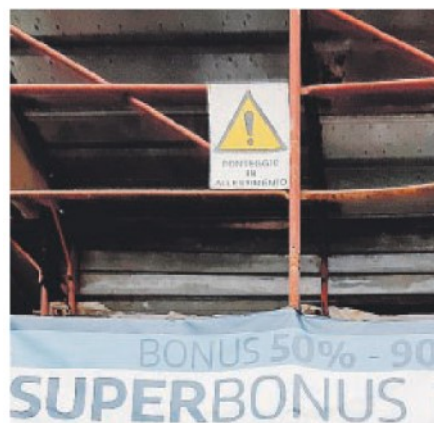
COSA È Il Superbonus è l'agevolazione fiscale disciplinata dall'art. 119 del decreto legge n. 34/2020 (decreto Rilancio) Consiste in una detrazione del 110% delle spese sostenute a partire dal luglio 2020 per la realizzazione di interventi finalizzati all'efficienza energetica e al consolidamento statico o alla riduzione del rischio sismico degli edifici