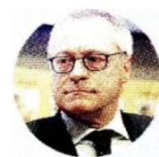
Carlo Bonomi. Il presidente di Confindustria: «Bene Meloni sulle imprese ma cogliere suggerimenti»