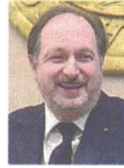
Ugo Patroni Griffi Presidente dell'Autorità di sistema portuale dell'Adriatico Meridionale