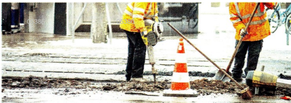
Cantieri. Il nuovo Codice degli appalti cambia le procedure sulle gare