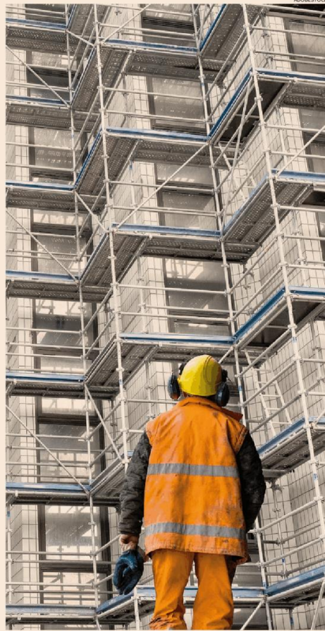
Verso l'approvazione definitiva. La conversione definitiva del Senato potrebbe arrivare domani con la fiducia

Per gli interventi diversi dal superbonus, la liquidazione dei lavori in base agli stati di avanzamento è soltanto una facoltà e non un obbligo: viene