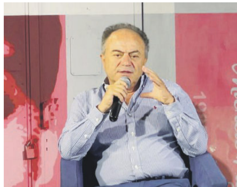
Nicola Gratteri ospite oggi a Foggia al dipartimento di Giurisprudenza

Per la complessità delle sue indagini, è soprannominato il magistrato dei due mondi (giacché molte delle sue inchieste portano ed hanno portato negli USA e nell'America del Sud). È costretto a vivere sotto scorta dall'aprile del 1989, cioè da quando la sua prima indagine