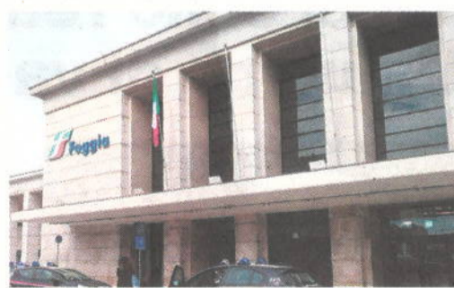
Stazione del capoluogo dauno

La maggior parte delle gare andate deserte, ben 356, riguarda il settore dei lavori, 162 nel settore dei servizi, 60 riguardano appalti per forniture. Sono soltanto 83 le gare a procedura aperta andate deserte. Per il resto si tratta per lo più di procedure negoziate per affidamenti sotto soglia - ben 223 gare con questa tipologia di scelta del contraente - seguite da 199 affidamenti diretti, 52 con procedura negoziata sen-