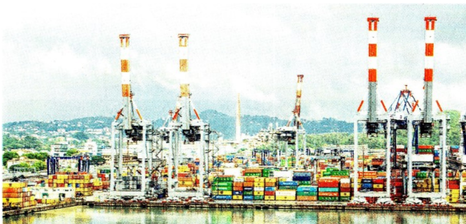
La riforma dei porti. Il governo punta ad andare incontro alle richieste Ue, soprattutto sui poteri all'Autorità dei trasporti