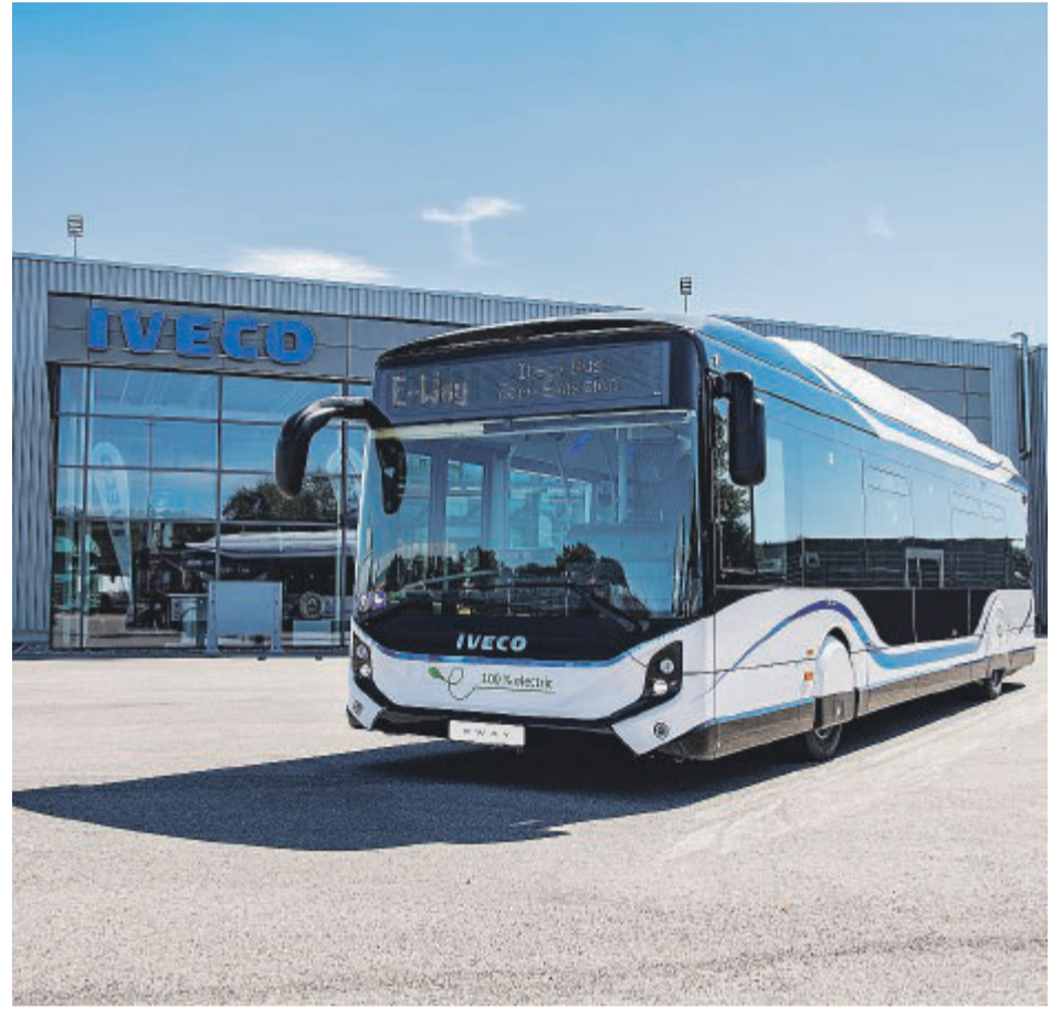
FOGGIA Uno dei bus totalmente elettrico in produzione a Foggia