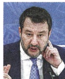
I ministri Antonio Tajani (Esteri), Raffaele Fitto (Affari europei), Gilberto Pichetto Fratin (Ambiente) e Matteo Salvini (Trasporti)