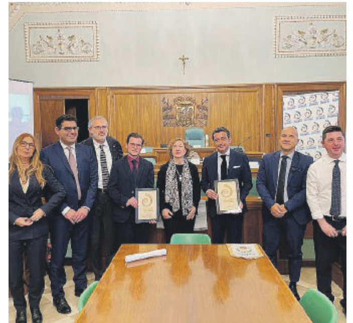
LA CERIMONIA Monte S. Angelo e Lesina sono «Comuni sostenibili»