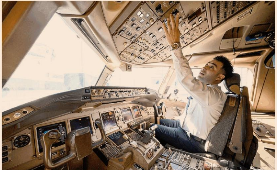
La domanda di voli aerei. Controlli di volo prima della partenza di un Boeing 777

I motivi di questa corsa sono diversi. Anzitutto i rincari del carburante, che nella tipologia necessaria per l'aviazione ha toccato a inizio anno i 130 dollari al barile per