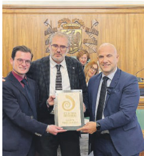
RICONOSCIMENTO Premiata Monte Sant'Angelo