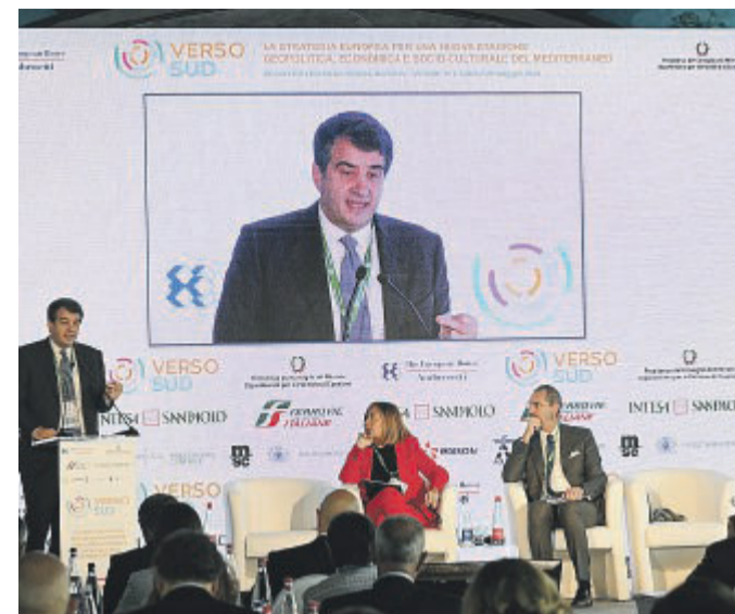
«VERSO SUD» L'intervento del ministro Fitto al forum di Sorrento