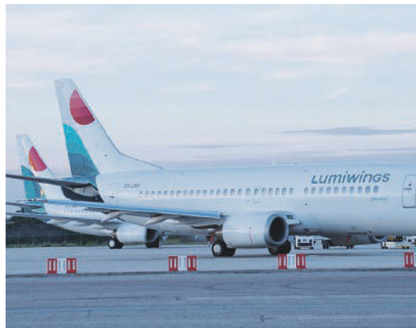
Gli aerei della Lumiwings di stanza allo scalo di Foggia

ciò che è stato fatto per i collegamenti ferroviari, duplicati, a Bari e Brindisi. A Foggia al riguardo nulla, seppur vi è la novità del raddoppio per la stazione AV del finanziamento da 40 a 80 mln di euro. E così per lo scalo aereo foggiano nessun accenno al collegamento ferroviario con la rete/stazione AV distante solo 3,5 km. Eppure Foggia è l'unico nodo/polo urbano crocevia di 2 Corridoi della Rete TEN-T. Non è servita nemmeno l'affermazione del presidente nazionale dell'Enac che ha parlato di ruolo 'istituzionale' dell'aeroporto foggiano. Quindi nemmeno la specializzazione di sede logistica del Polo regionale ed europeo (Balciani) della Protezione civile serve ad AdP e Regione per prevederlo e questo