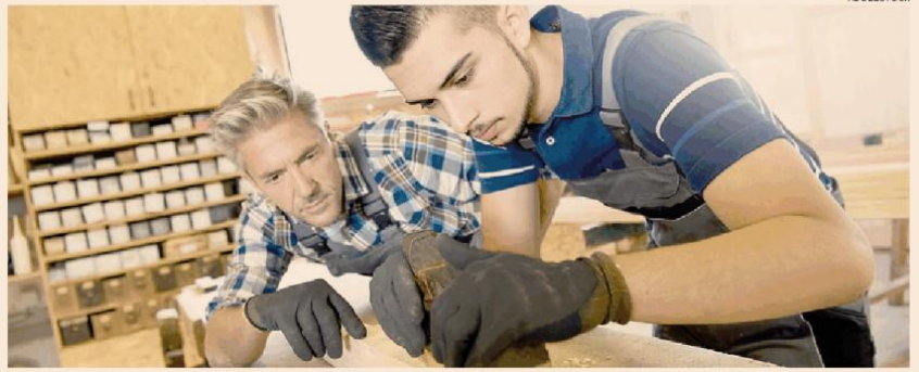
Formazione. Il bonus Neet può essere usato anche per assumere con contratto di apprendistato professionalizzante

Decreto Lavoro. I datori intenzionati ad assumere giovani under 30 che non studiano e non lavorano possono chiedere l'incentivo fino a esaurimento