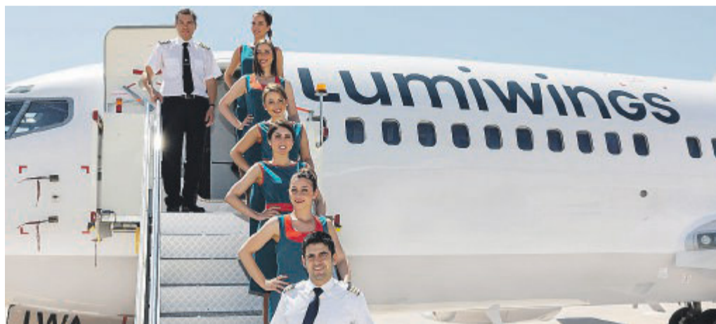
Aereo e personale della Lumiwings che collega Foggia con Milano, Torino, Catania, Verona e Mostar

«Secondo noi di Mondo Gino Lisa ci sono grandi speranze per l'aeroporto di Foggia. Lo dimostrano i dati. Lo dimostrano i