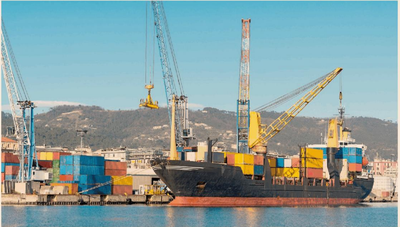
Esportazioni. Pmi sempre più strategiche negli scambi con l'estero