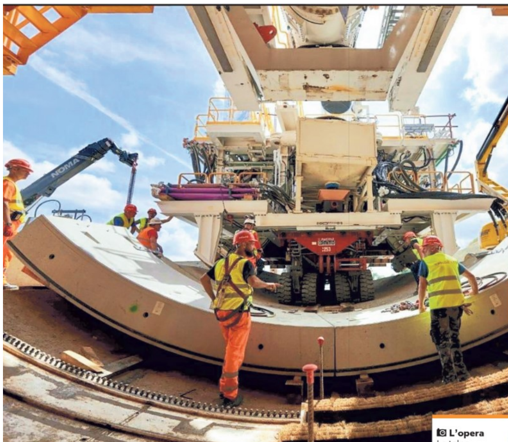
📷 L'opera La talpa meccanica Aurora di Webuild, che sta scavando la galleria di Grottaminarda sulla linea ad alta velocità Bari-Napoli