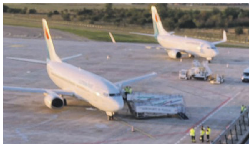
ARRIVI E PARTENZE I due Boeing 737 della Lumiwings sulla pista dell'aeroporto foggiano

E' un momento di importanti valutazioni adesso questo per il Gino Lisa e la compagna Lumi-