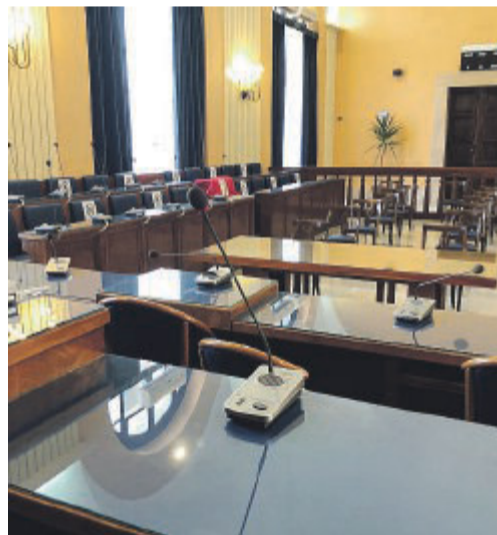
L'aula consiliare di Palazzo di città