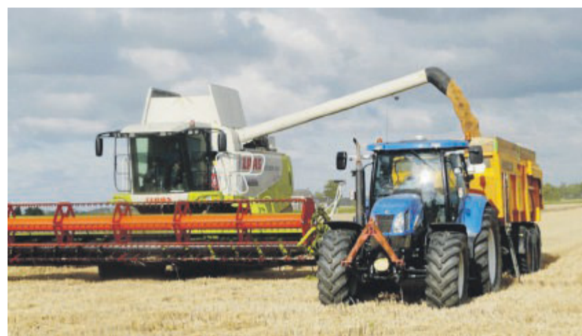
GRANO DURO Nel corso del 2023 è precipitato il prezzo del cereale

Va in picchiata il valore riconosciuto al grano duro pugliese e la redditività delle aziende cerealicole, segnala Cia secondo cui dal 29 giugno 2022, quando il prezzo medio del grano du-