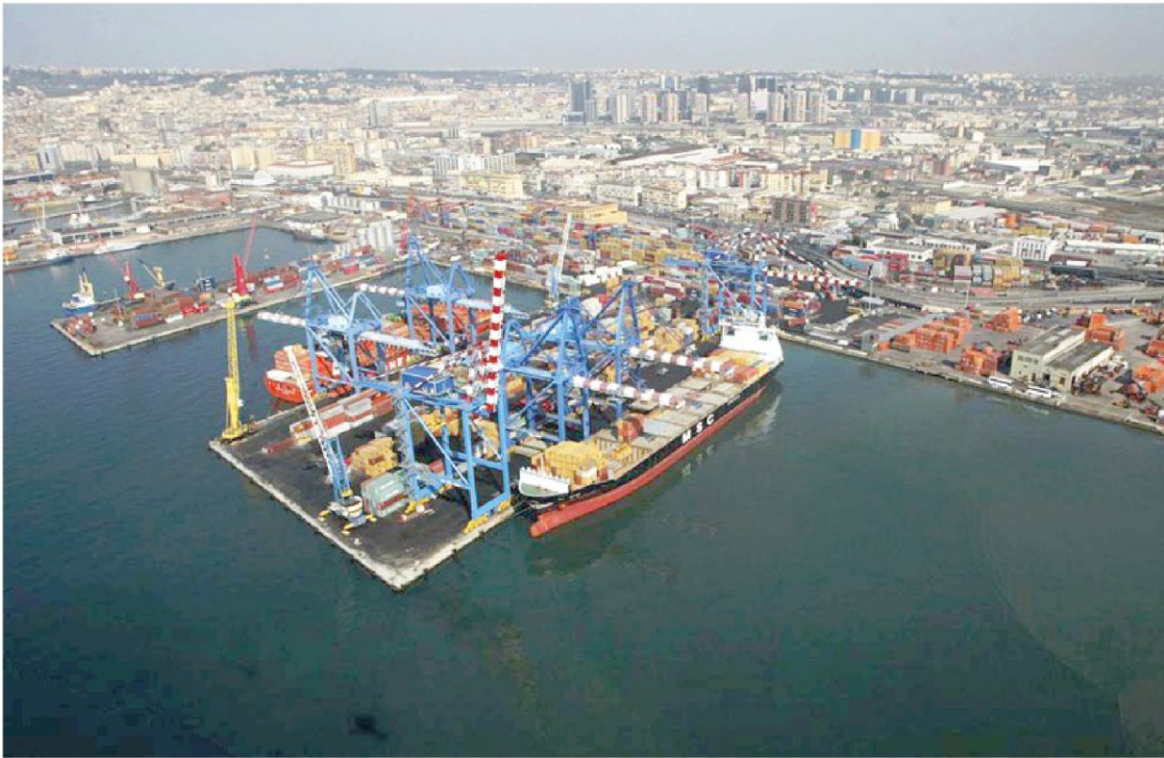
Procedure speciali. Una veduta aerea del porto di Napoli