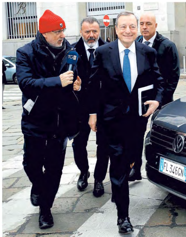
▲ A Milano L'arrivo di Draghi nella sede di Bankitalia