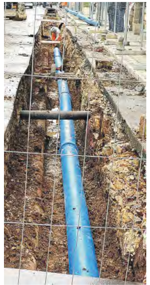
FINO AL 2025 La concessione di Aqp è in scadenza

Se ne riparlerà la prossima settimana. Ma sulla proposta Amati il Pd appare freddo: se non è la Regione a scegliere direttamente il gestore - è il ragionamento - non serve una legge, e non serve un nuovo comitato che è in tutto e per tutto sovrapponibile all'attuale Autorità idrica. L'Aip oggi è saldamente in mano al centrosinistra. [m.s.]