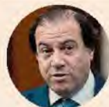
MAURIZIO LEO Il viceministro all'Economia apre alle richieste del Parlamento di modificare il concordato

Di fatto, questo dovrebbe essere consentito da un duplice ordine di fattore. Da un lato, l'elaborazione della proposta di concordato preventivo da parte del Fisco che avverrà sostanzialmente all'atto della compilazione delle pagelle fiscali (in gergo tecnico si chiamano indici di affidabilità fiscale: Isa), in questo snellendo la procedura di invio dei dati, attesa della risposta e successiva accettazione o rifiuto da parte del contribuente. Dall'altro lato, verrebbe sdoppiato il sistema dei versamenti: lasciando in estate quelli "normalmente" dovuti sulla base dei calcoli ordinari e rinviando invece all'acconto di novembre il versamento dell'acconto sull'eventuale differenza del reddito deciso in fase di concordato.