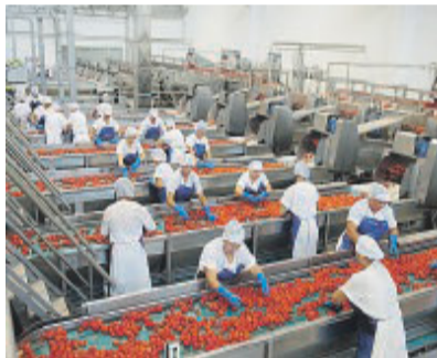
FOGGIA Lo stabilimento Princes

«Con il rincaro dei costi energetici che si è trasferito a valanga sui costi di produzione, nel 2023 - ricorda Coldiretti - produrre un ettaro di pomodoro lungo è costato agli agricoltori in media 3.000 euro in più, mentre allo scaffale si paga più la bottiglia che il pomodoro. Ai ritardi registrati in campagna nel trapianto delle piantine di pomodoro a causa del clima pazzo nel 2023 si sono aggiunti l'aumento dei prodotti energetici e delle materie prime che si riflette sui costi di