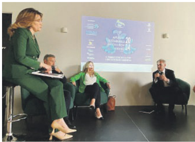
IL PREMIO È stato promosso da Confindustria Puglia