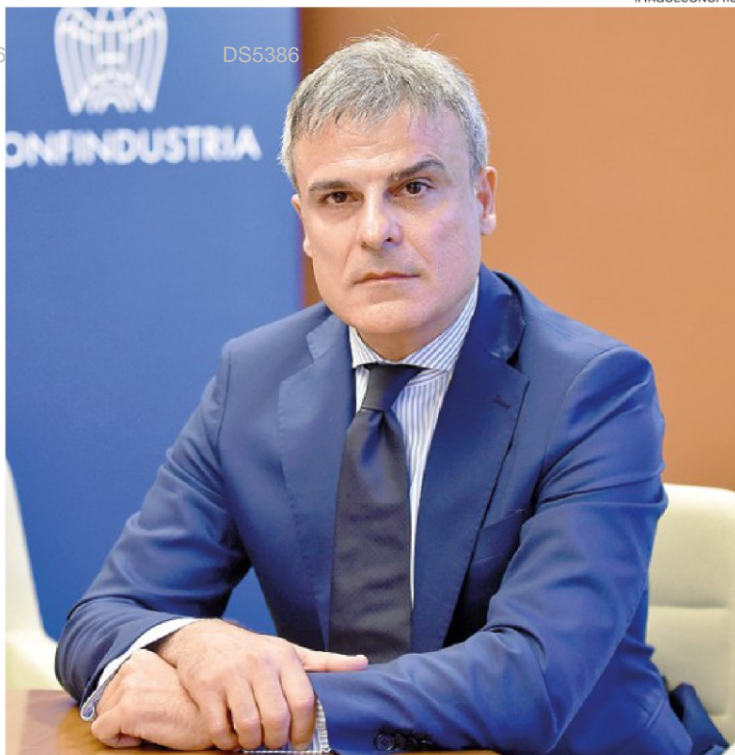
Imprese. Natale Mazzuca, vice presidente di Confindustria per le Politiche Strategiche per lo Sviluppo del Mezzogiorno