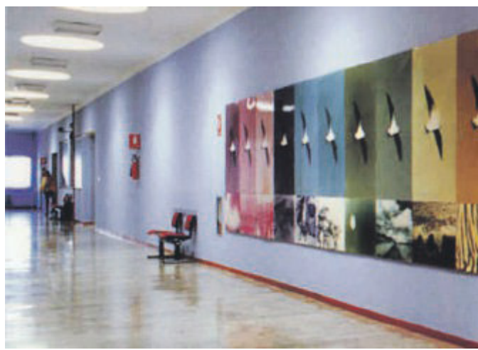
A VALENZANO La sede di InnovaPuglia che si occupa di informatica