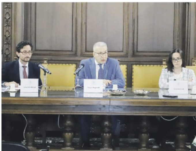
ANDAMENTO ATTIVITÀ ECONOMICA IN PUGLIA A sinistra nella foto di Fasano un momento del convegno. In alto un grafico estratto da «L'economia della Puglia - Rapporto annuale 2024»