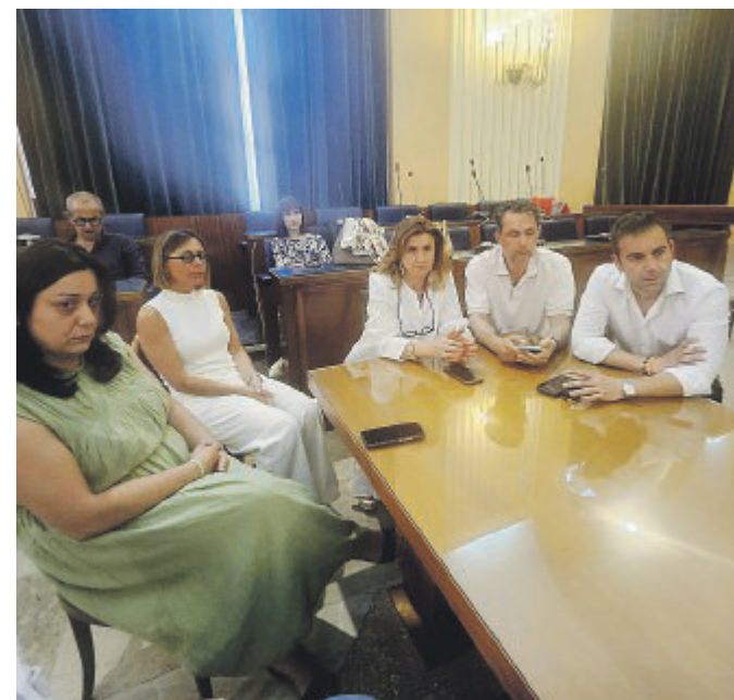
Un momento dell'incontro tenuto al Comune