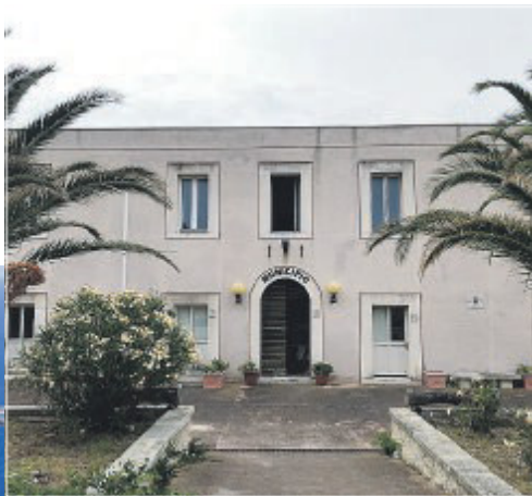
ISOLE TREMITI Una foto dall'alto dello splendido arcipelago della provincia di Foggia e nel riquadro la sede municipale nell'isola di San Nicola