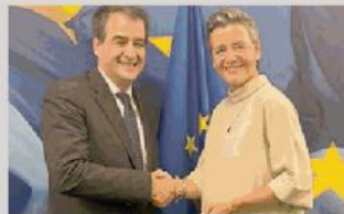
Intesa. Raffaele Fitto e Margrethe Vestager

agli sgravi per le assunzioni previsti dal decreto Coesione, in attesa della nuova misura che entrerà in vigore dal 1° gennaio 2025 e che non potrà più ripetere le attuali possibilità, ma dovrà essere a lungo termine, orientata alla crescita e agli investimenti. Per disegnarla ci confronteremo sin da ora con la Commissione, con lo