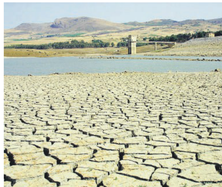
L'EMERGENZA L'invaso di Scanzano (Palermo): in Sicilia è stato di calamità

Stato di calamità in Sicilia. Puglia e Basilicata in ginocchio