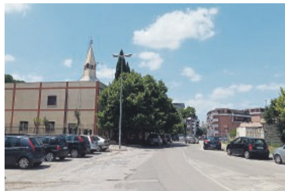
FOGGIA Il rione Martucci

polari (stanziati 2.232.000, spesi 440.584); stesso dicasi per la sostituzione degli insediamenti abusivi lungo via Capitanata con altri 56 alloggi (stanziati 5.053.804, spesi 523.321); fermi i lavori per la realizzazione di un impianto indoor di atletica leggera e quelli de-