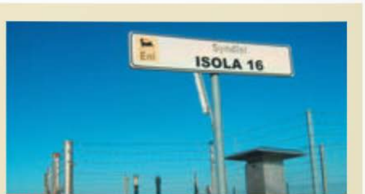
Area ex Enichem

Cagliari, Dipartimento Ambiente e Salute, Istituto Superiore di Sanità; Istituto Zooprofilattico delle Venezie; Università di Padova; Università statale di Milano; Isti-