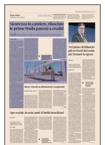
In cantiere. La patente a crediti da ieri è richiesta a imprese e lavoratori autonomi per operare in edilizia