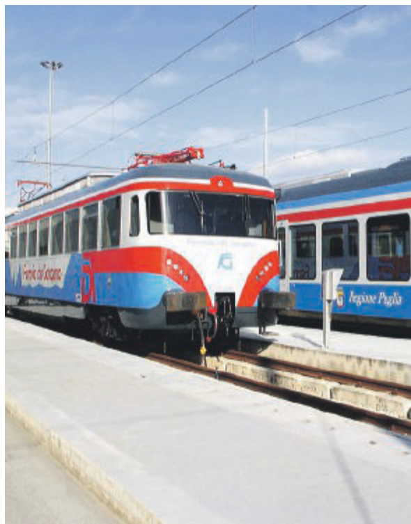
I treni di Ferrovie del Gargano sulla tratta Foggia-Lucera

CAPITANATA DUE LE PRINCIPALI VERTENZE: L'ARRIVO DEGLI STUDENTI DALLA PROVINCIA VERSO IL CAPOLUOGO E IL RIENTRO SERALE SUI MONTI DAUNI