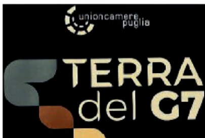
IL MARCHIO Con la foglia dell'ulivo