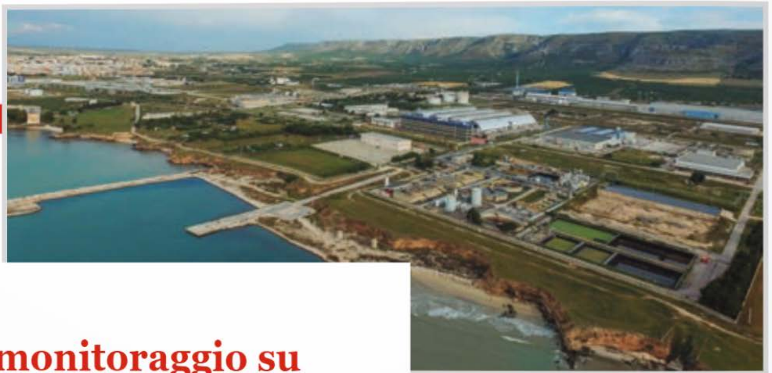
Area ex Enichem a Macchia di Monte Sant'Angelo