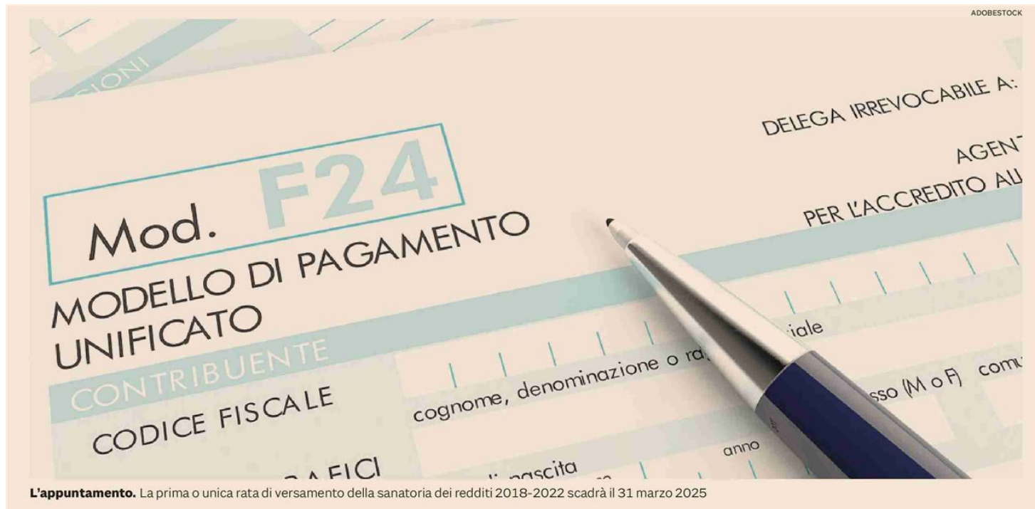
L'appuntamento. La prima o unica rata di versamento della sanatoria dei redditi 2018-2022 scadrà il 31 marzo 2025

Per chi non aderirà più alto il rischio di sanzioni accessorie come la sospensione dell'attività