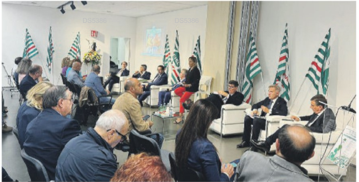
A destra, una tavola rotonda organizzata dalla Cisl alla Fiera del Levante