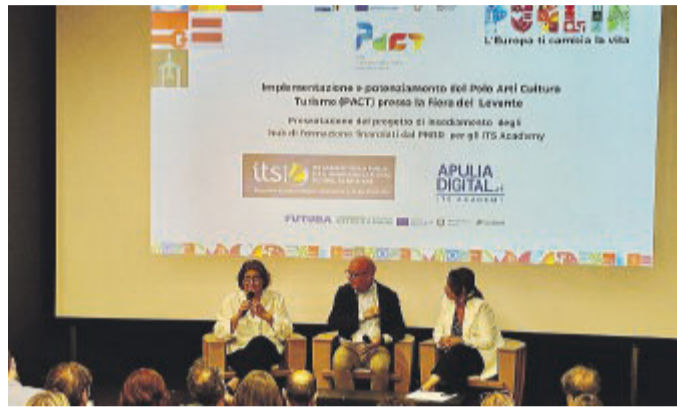
IL «PACT» ALLA FIERA La presentazione del progetto regionale

Questa la finalità di un nuovo progetto finanziato dal Piano nazionale ripresa e resilienza di due fra i maggiori Its pugliesi: Its Academy Turismo e ITS Academy Apulia Digital. L'incontro moderato dal direttore della «Gazzetta del Mezzogiorno», Mimmo Mazza - è stata l'occasione per presentare il progetto alla presenza di Viviana Matrangola (assessore regionale alla Cultura, Tutela e sviluppo delle imprese culturali, Politiche migratorie, Legalità e Antimafia sociale), Sebastiano Leo (assessore regionale alla Formazione e Lavoro, Politiche per il lavoro, Diritto allo studio, Scuola, Università e Formazione professionale), Aldo Patruno (direttore Di-