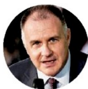
Emanuele Orsini. Il Presidente di Confindustria ieri ha incontrato la presidente dell'Europarlamento Metsola

Il presidente di Confindustria a Bruxelles vede la presidente dell'Europarlamento, Metsola