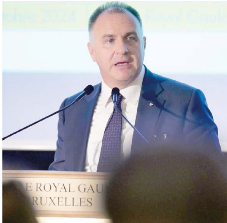
Leader degli industriali. Emanuele Orsini, presidente di Confindustria