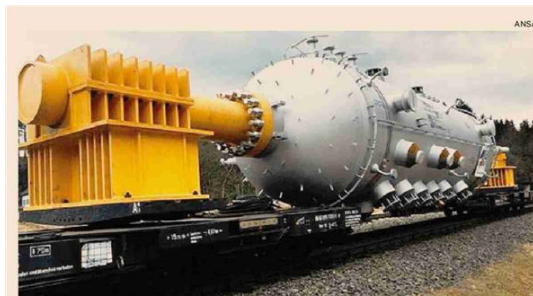
Nucleare. Il governo punta sulle nuove tecnologie sostenibili