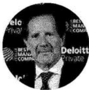
FABIO POMPEI Ceo di Deloitte Italia