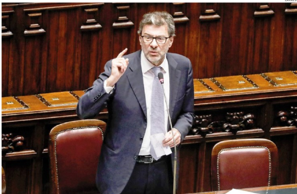
Verso il Cdm. Oggi in Consiglio dei ministri il titolare dell'Economia Giancarlo Giorgetti presenterà non solo il Documento programmatico di bilancio, ma anche il decreto legge fiscale e legge di Bilancio 2025

Nello scenario programmatico il Piano strutturale di bilancio fissa il deficit al 3,3% del Pil nel 2025 (con un peggioramento di 0,4 punti sul tendenziale)