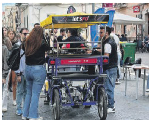
Ipogei di Foggia e sotto i Campi diomedei

Pensato per questa prima fase per circa 14mila persone che vivono, studiano e lavorano intorno al mondo accademico a Foggia.