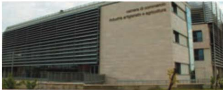
A Foggia crescono le società di capitali

S egnali di fiducia per il sistema imprenditoriale italiano nel 3° trimestre 2024, ma non mancano le ombre. Bene i settori dei servizi professionali e del turismo, meno bene quelli del commercio e dell'artigianato. Sulla base dei dati Movimprese al 3° trimestre, si registra un saldo attivo di 15.227 attività economiche, frut-