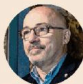
ROBERTO CINGOLANI Amministratore delegato del gruppo Leonardo

L'indebitamento finanziario netto al 30 settembre era di 3,12 miliardi, -19% rispetto al proforma di 12 mesi prima e -18,2% rispetto al dato pubblicato nel 2023 (3,81 miliardi). Confermate le stime, la «guidance», per l'intero esercizio.