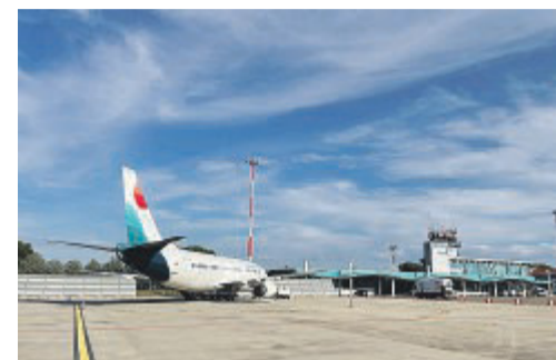
FOGGIA L'aeroporto Gino Lisa

Dall'aeroporto di Foggia con Lumiwings dall'1 dicembre per tutto l'inverno