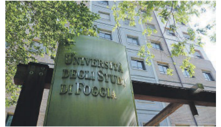
FOGGIA La sede del Rettorato in via Gramsci