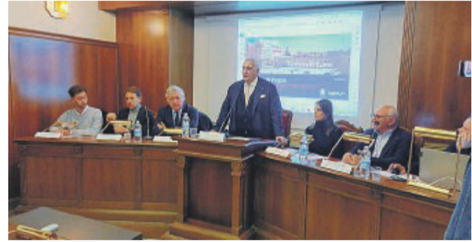
FOGGIA La conferenza in Confindustria

Intercettato un Fondo internazionale per gli investimenti presto un confronto con l'amministrazione comunale