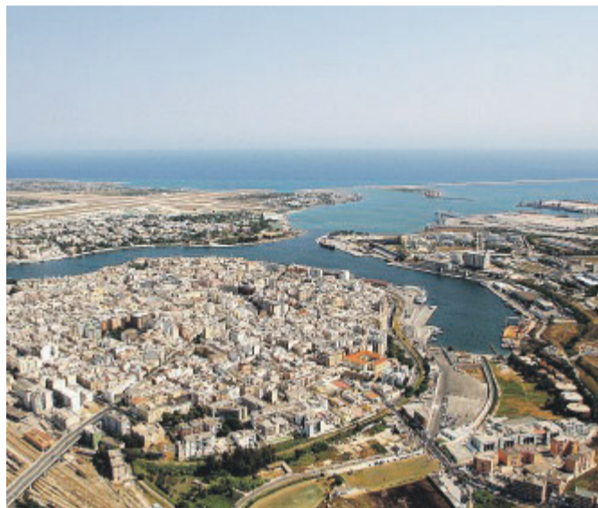
BRINDISI L'area portuale