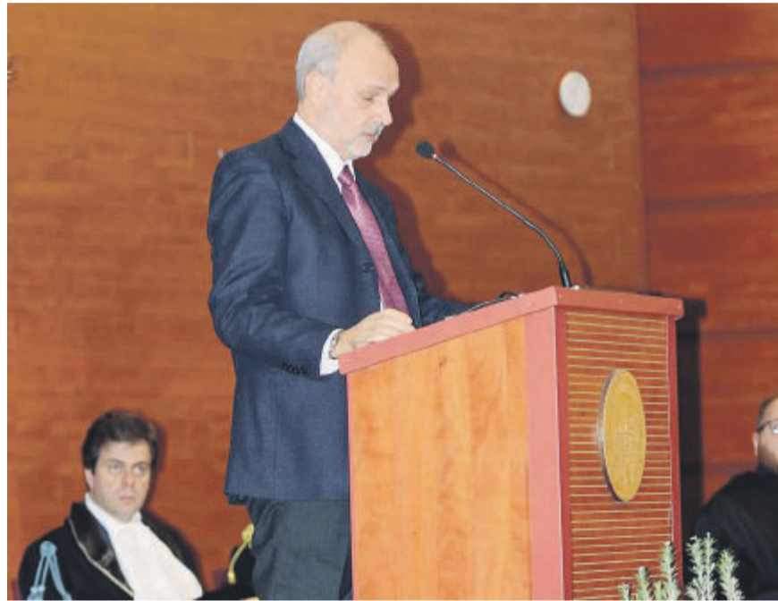
FOGGIA L'intervento del ministro Schillaci a Foggia

Il tema principale della cerimonia di Foggia è stato appunto quello della «cura», sviluppato in particolare dalla prolusione affidata al prof. Gaetano Servidio, Direttore del Dipartimento di Scienze Mediche e Chirurgiche dell'ateneo foggiano con l'intervento su «Intelligenza artificiale e arte della cura: contraddizione o rivoluzione?», che ha offerto spunti riflessione sulle opportunità e i rischi dell'intelligenza artificiale nell'ambito medico e sanitario. La cura declinata in diversi ambiti, dalle relazioni umane alla sostenibilità ambientale, fino alle sfide del sistema sanitario, ha caratterizzato anche l'intervento di padre Paolo Benanti, presidente della commissione Intelligenza artificiale (Ai) della Presidenza del Consiglio dei ministri e membro del comitato intel-