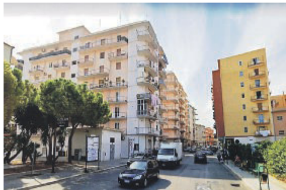
MANFREDONIA Via Gargano, una delle arterie principali della città sipontina