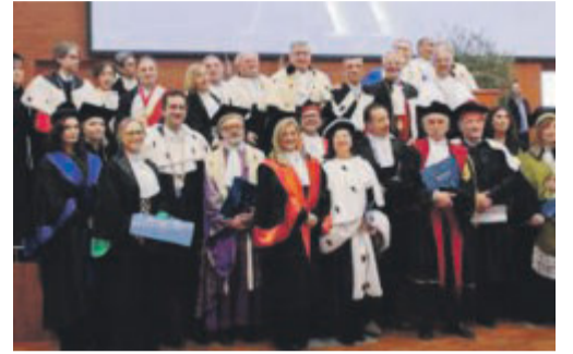
Rettori e docenti sul palco dell'aula magna

«In questi primi 25 anni ha saputo affrontare le sfide del nostro tempo con determinazione, garantendo ai propri studenti un percorso di formazione solido, moderno e sempre più competitivo. Il concetto di cura, richiamato dal Magnifico Rettore Lorenzo Lomuzio, rappresenta al meglio la missione dell'ateneo: prendersi cura della formazione dei giovani, della crescita del territorio e della costruzione di un futuro più giusto e inclusivo. La cura è il valore che trasforma l'incertezza in sicurezza, che ci rende più forti contro l'individualismo e più consapevoli dell'importanza di costruire una società in cui tutti si sentano parte di un progetto comune.», ha aggiunto il presidente della Provincia di Foggia.