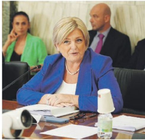
MINISTRA Marina Elvira Calderone nata 60 anni fa a Bonorva in provincia di Sassari è a capo del Dicastero del lavoro e delle politiche sociali dal 2022

«Daremo una nuova opportunità ai lavoratori e alle aziende, con un testo aperto alle considerazioni delle diverse parti in gioco, frutto di un'elaborazione culturale lontana nel tempo, di un lavoro – soprattutto della Cisl di Luigi Sbarra – sui territori e di un impegno parlamentare da parte dei nostri deputati e senatori. Noi vogliamo rafforzare la collaborazione tra i datori di lavoro e i lavoratori, preservare e incrementare i livelli occupazionali e valorizzare economicamente e socialmente il lavoro e rafforzare il valore della contrattazione».