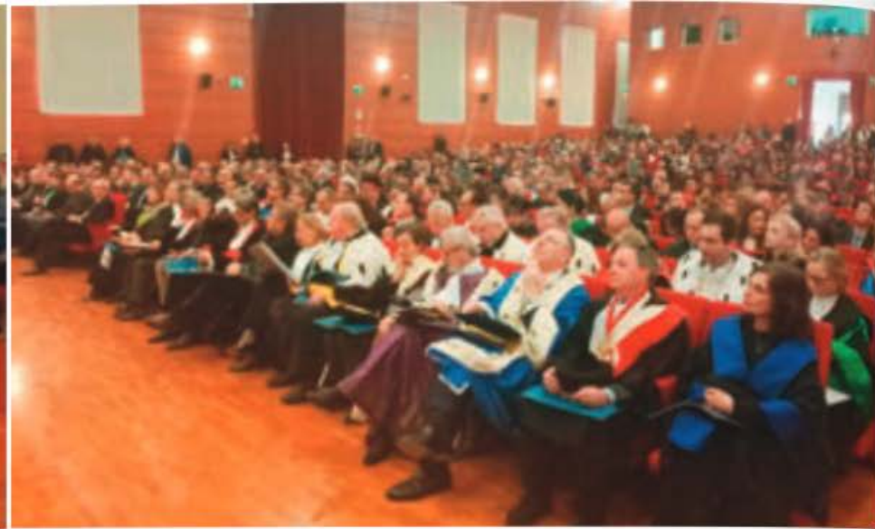
La cerimonia e le toghe ospiti