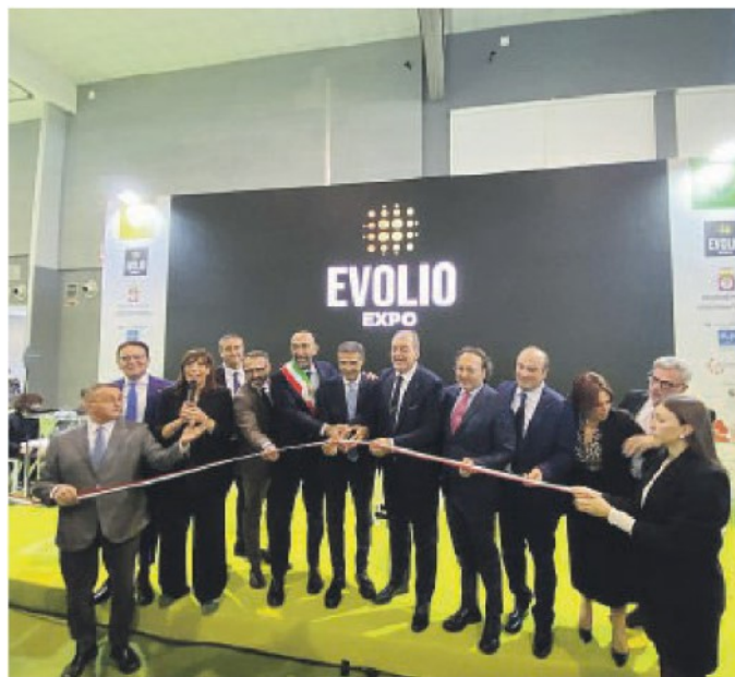
LA CERIMONIA DI APERTURA Il taglio del nastro con le autorità

nella filiera agroalimentare pugliese rappresenta un'eccellenza unica e che ha bisogno di essere riconosciuta in maniera sistemica e qualificata, come accade per i nostri vini. Un riconoscimento che deve avvenire su multipli canali, dai mercati e dai consumatori, di oggi e del domani. Evolio Expo è il primo atto di una strategia di lungo respiro: una fiera specializzata con al centro gli imprenditori, il partenariato agricolo e le Città dell'Olio, i medici e i ricercatori impegnati a garantire il valore nutraceutico del nostro oro verde e l'apporto salutistico che proviamo ogni giorno ad insegnare anche ai nostri ragazzi nelle scuole. In un filo di olio extravergine di oliva ci sono storie, c'è il lavoro di intere generazioni di pugliesi, c'è la capacità di innovare e di rinascere. Un messaggio che dalla Fiera del Levante parte forte e chiaro».