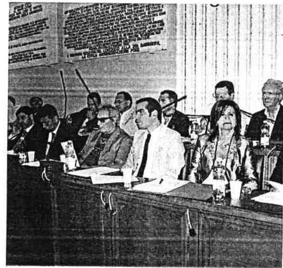
Il centrodestra ha votato a favore, nel 2008 votò contro

Consiglio comunale, il sindaco di Foggia chiederà in tempi rapidissimi un incontro con l'assessore Barbanente, in modo da sollecitare alla Regione Puglia la chiusura della procedura. «Ovviamente affinché questo strumento possa produrre i risultati auspicati occorre che la realizzazione degli