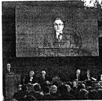
VISCO Durante l'assemblea di Bankitalia

Il numero uno di Via Nazionale raccomanda poi di operare prima bene in casa propria al fine di essere meglio ascoltati nel contesto europeo. Nella Commissione, osserva, convivono