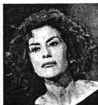
Luísa Todini Presidente Poste Italiane

«Siamo usciti dalla malattia della recessione, speriamo che ci sia la ripresa», perché «siamo in convalescenza»