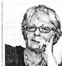
Annamaria Furlan Segretaria generale Cisl

«È importante che il governatore abbia messo l'accento sull'occupazione, sugli investimenti pubblici e privati e sul Sud»