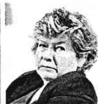
Susanna Camusso Segretaria generale Cgil

«La ripresa la sentiamo un po' a stento, ma qualcosa c'è, la riforma del lavoro sta dando i primi risultati. Però il problema del credito rimane»