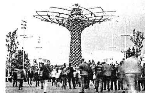
LA FABBRICA DEL GUSTO

L'inaugurazione della mostra Fab Food, la fabbrica del gusto italiano, si terrà oggi al termine dell'assemblea di Confindustria, con il presidente Squinzi e il ministro Guidi che taglieranno il nastro. Il progetto, curato dal Museo Nazionale della Scienza e