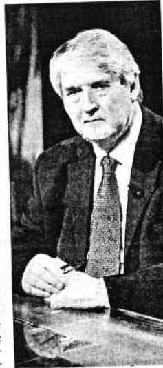
Lavoro. Il ministro Giuliano Poletti

Non si è parlato ieri di riordino delle tipologie contrattuali, anche se il governo è deciso a cambiare la contestata clausola di salvaguardia che prevede un contributo per le gestioni previdenziali, a carico di datori di lavoro e autonomi, per le stabilizzazioni dei collaboratori, se i fondi della legge di stabilità saranno insufficienti coprire un'eventuale ondata di trasformazioni di