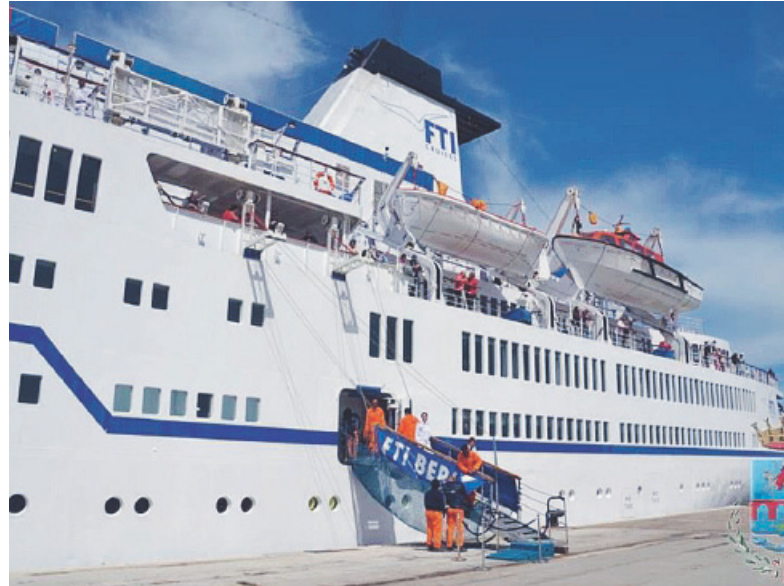
Una delle navi attraccate a Manfredonia

Al tavolo tecnico hanno preso parte i rappresentanti dell'Agenzia De Girolamo, l'amministratore unico dell'Agenzia del Turismo Sa-