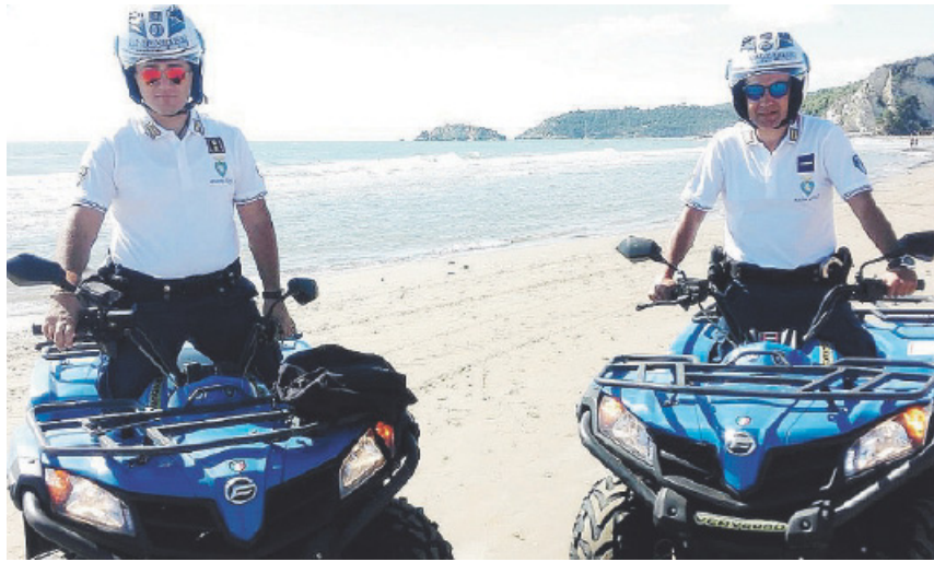
VIESTE Le pattuglie della polizia municipale a bordo dei "quad-bike"