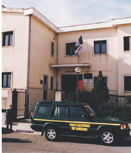
MONTE S. ANGELO La sede del Parco

Da ricordare inoltre che tra le figure apicali vacanti al Parco c'è anche quella del direttore. Figura che dovrebbe però essere riempita a breve poiché è stato varato il bando (il termine scade il 12 luglio 2018 alle ore 12,00). Tra tutte le istanze pervenute sarà individuata, da parte del consiglio direttivo dell'ente, una rosa di tre nominativi che sarà sottoposta all'esercizio ministeriale del potere di nomina. Ma è sulla presidenza del Parco che si concentrano le attenzioni maggiori dei diciotto Comuni dell'area protetta che formano la Comunità del Parco, i cui sindaci nel febbraio del 2017 all'allora ministro dell'Ambiente Gianluca Galletti ed al presidente della Regione Puglia Michele Emiliano indicarono una terna di nomi, presenti ben due peschiciani, vale a dire l'avvocato Gianni Maggiano ed il coordinatore regionale No Triv Raffaele Vigilante.