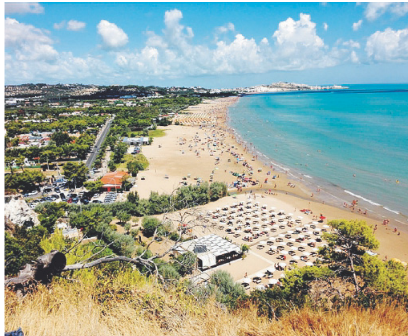
VIESTE Nel 2017 la cittadina garganica ha registrato il primato di presenze turistiche in Puglia con quasi due milioni di visitatori, 900 mila in più della località più visitata del Salento che è Ugento

Va ricordato che Vieste, con quasi due milioni di presenze nel 2017, è la località più visitata della Puglia e distanza di 900 mila presenze la località più visitata del Salento, che è Ugento. Dati che dovrebbero far riflettere sull'importanza del turismo per l'economia della provincia di Foggia e della Puglia in generale.