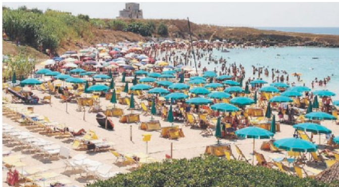
CON LE «STELLE» Un nuovo sistema per la classificazione dei lidi