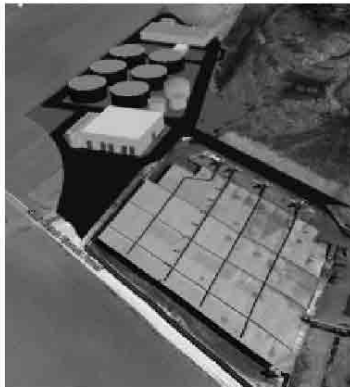
Il nuovo impianto pensato da Maia Rigenera