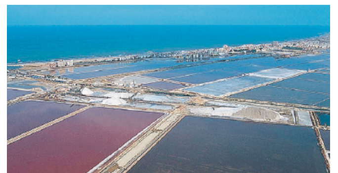
MARGHERITA DI SAVOIA Le Saline

distanti dal canale e dalla sua foce, e dovuta alla presenza alla presenza di beta-carotene, rilasciato da una micro-alga presente in salina, la dunaliella salina che alimenta i fenicotteri e ne determina la colorazione delle ali: è quindi parte di un processo naturale e di un ecosistema virtuoso che da sempre contraddistingue la salina margheritana, pre-