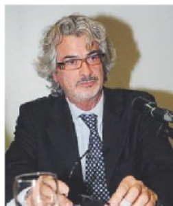
Obi Antonio Corvino

Le previsioni dell'Obi evidenziano un rallentamento della crescita per l'Italia per il 2018 (+1,4%) e per i prossimi cinque anni, dal 2019 al 2023, con una media dello 0,8%. Più contenuta dovrebbe risultare la crescita del Mezzogiorno sia rispetto alla media nazionale che rispetto alle altre aree del Paese. Si stima, infatti, una crescita annua dello 0,6% nel 2019-2023 (+0,7% per il Nord Ovest, +0,8% per il Nord Est e +0,9% per il Centro Italia): il divario, dunque, è destinato ad allargarsi. In particolare Abruzzo, Basilicata, Puglia e Sicilia cresceranno ad un ritmo più contenuto rispetto alla media del Sud mentre Calabria, Campania, Molise e Sardegna andranno meglio (ma comunque con una crescita al di sotto dell'1%). Tra i comuni capoluoghi di provincia, andrà meglio per Avellino (+3,47%), Ragusa (+2,7%), Catania (+2,37%), Caserta (+2,05%) e Palermo (+2,02%) mentre negative risultano le previsioni per Oristano (-0,11%), Benevento (-0,33%), Nuoro (-0,33%) e Trapani (-0,44%). «Il Mezzogiorno - dichiara il Presidente dell'Obi Salvatore Matarrese - ha un bisogno spasmodico di un programma di investimenti su infrastrutture e logistica, porti e ferrovie, zone economiche speciali, industria manifatturiera, tecnologia e ricerca».