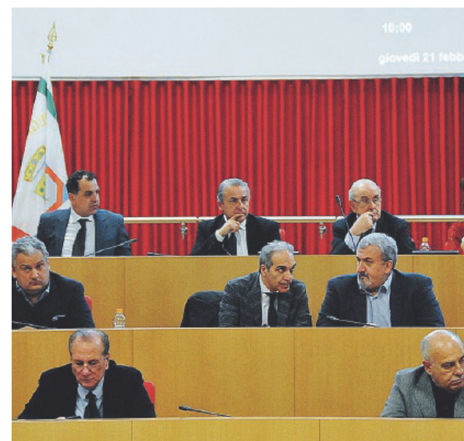
LA NUOVA AULA Due momenti della prima riunione

Il presidente: «Abbiamo speso molto meno di altri, eravamo gli unici in Italia a dover stare in un condominio»