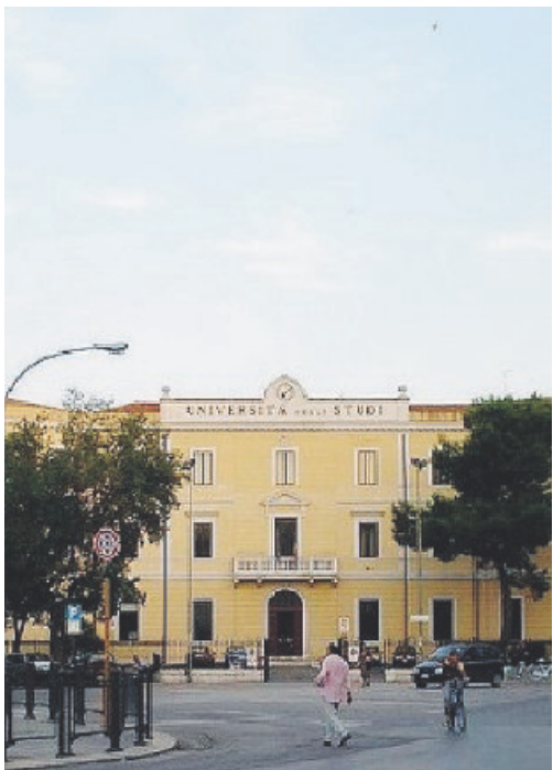
Il dipartimento di Giurisprudenza