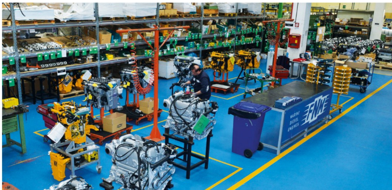
Basilicata. Le nuove linee produttive della Cmd (partnership italo-cinese) di Atela che realizzerà una nuova generazione di motori per aerei da trasporto passeggeri e merci