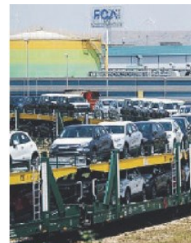
MELI La fabbrica Fca