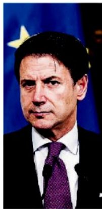
PREMIER Giuseppe Conte

E gregio presidente Conte, condividiamo senza riserve l'impostazione da lei conferita al nuovo programma di interventi nell'Italia meridionale previsti dal Governo, da non considerarsi affatto quale atto di puro solidarismo, ma da collegarsi invece saldamente al rilancio dell'intera economia nazionale e dei suoi settori trainanti.