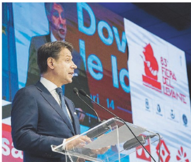
IL 14 SETTEMBRE Il premier Giuseppe Conte alla Fiera del Levante di Bari