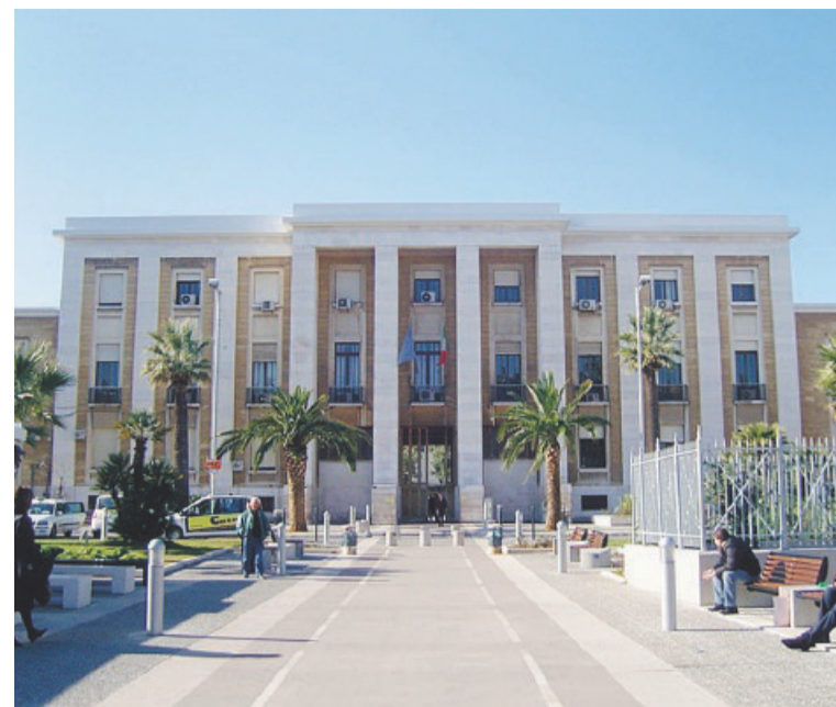
BOLLINO ROSA Tra gli ospedali premiati anche il Policlinico di Bari

Sono 13 gli ospedali in Puglia (su 335 in tutta Italia) che hanno ricevuto dalla Fondazione Onda, Osservatorio nazionale sulla salute della donna e di genere, il riconoscimento dei Bollini Rosa (fino a un massimo di 3), per il servizio del biennio 2020-2021. Massimo riconoscimento, con 3 bollini su 3, per l'Irccs Istituto Tumori Giovanni Paolo II di Bari e per l'Ospedale Casa Sollievo della Sofferenza di San Giovanni Rotondo (Fg). Ottimo risultato, con 2 bollini su 3, anche per il Policlinico di Bari, l'Ospedale Santa Maria (Bari), l'Ospedale San Paolo (Bari), la Casa di Cura Monte Imperatore di Noci (Ba), l'Ospedale della Murgia Fabio Perinei di Altamura (Ba), gli Ospedali Riuniti di Foggia, l'Ospedale SS. Annunziata di Taranto, l'Ospedale Miulli di Acquaviva delle Fonti (Ba), e la Casa di Cura Città di Lecce Hospital. Un bollino è stato assegnato, infine, allo Stabilimento Ospedaliero Di Venere di Bari e al D'amore Hospital di Taranto.