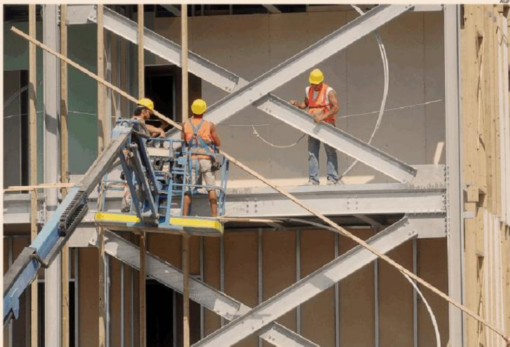
Lo stallo nell'edilizia. Entro il 15 gennaio imprese e sindacati sono invitati a presentare una lista di priorità al Mise

La risposta del Mise, comunicata da Patuanelli nel corso dell'incontro, avverrà in due fasi: entro il prossimo 15 gennaio imprese e sindacati sono invitati a presentare una lista di priorità sulle quali il Mise definirà una «griglia» di temi, i quali - se ci sarà un consenso di tutti - saranno approfonditi in singoli gruppi di lavoro con l'obiettivo di definire misure normative ad hoc.